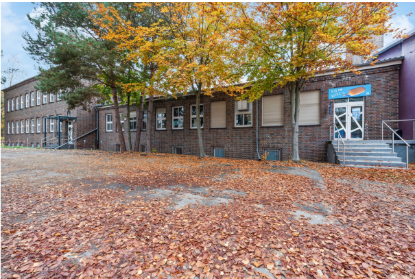
Gebäudeansicht von der Seite