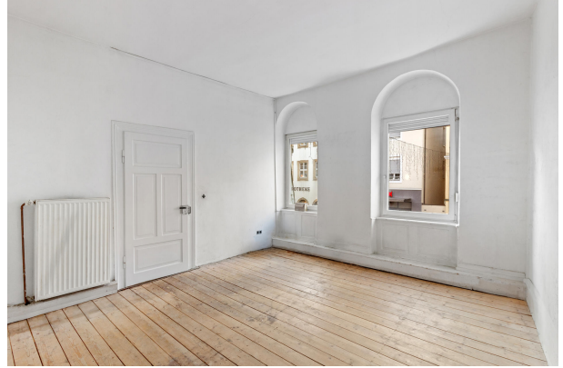
Lager / Küche