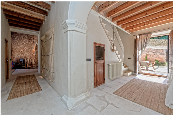
Bedroom 4 (ground floor)