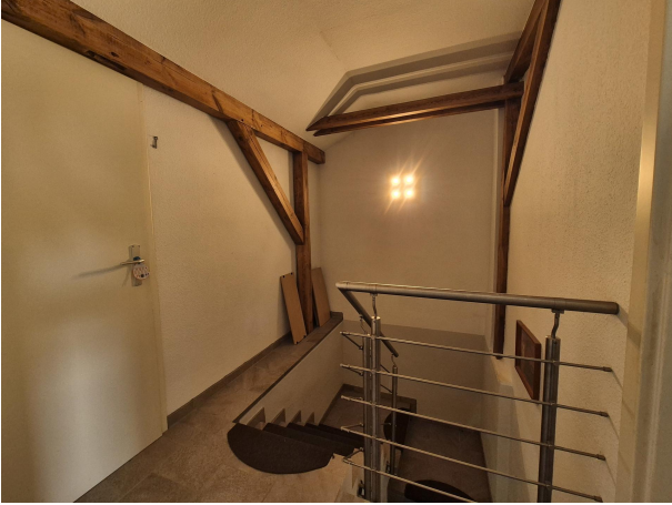
Raum für ein mögliches WC im DG